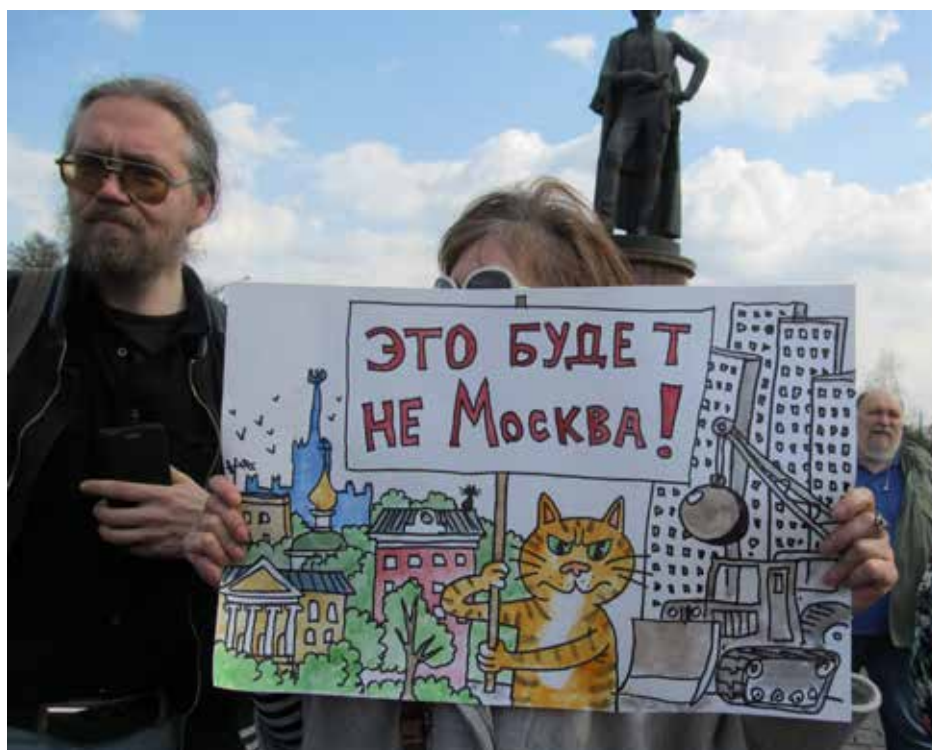
Илл. 2. Супруги с самостоятельно нарисованным плакатом на митинге 21 апреля 2018 года.

Неудивительно, что участники митингов активно поднимали вверх рисунки с зелеными деревьями или лозунги: «5-этажки это — зеленая уютная Москва / На реконструкцию!» (14 мая 2017), «Флора и фауна Москвы — жертвы реновации» (на митингах 28 мая 2017 года и 21 апреля 2018 года), «Мы хотим видеть дальше, чем окна дома напротив!» (28 мая 2017 года). Такие высказывания («Хрущевки — это экологически и социально комфортная для человека среда») — составили в среднем четверть от всех высказываний на митингах. На первом митинге их доля составила 20%, 28 мая она возросла до 27%, 12 июня — упала до 11%, а в 2018 году снова поднялась до 24%. Это довольно высокий показатель, особенно если мы учтем, что собственно политических высказываний — против действующей власти или указаний на то, что закон о реновации нарушает конституционные права — было значительно меньше (об этом см. далее).