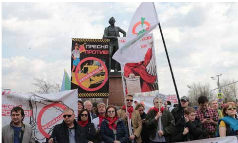
Илл. 3. Группа жителей Красной Пресни на митинге 21 апреля 2018 года.

Удельная доля индивидуальных высказываний — с местоимением «я» — снижалась от митинга к митингу, то есть индивидуальное высказывание о собственных проблемах не считалось продуктивным, «престижным». Зато процветали высказывания от групп людей о нуждах целого района или даже всего города.