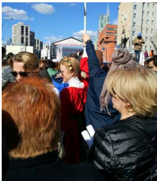
Илл. 6. Жительница района Марьино на митинге 14 мая 2017 года.