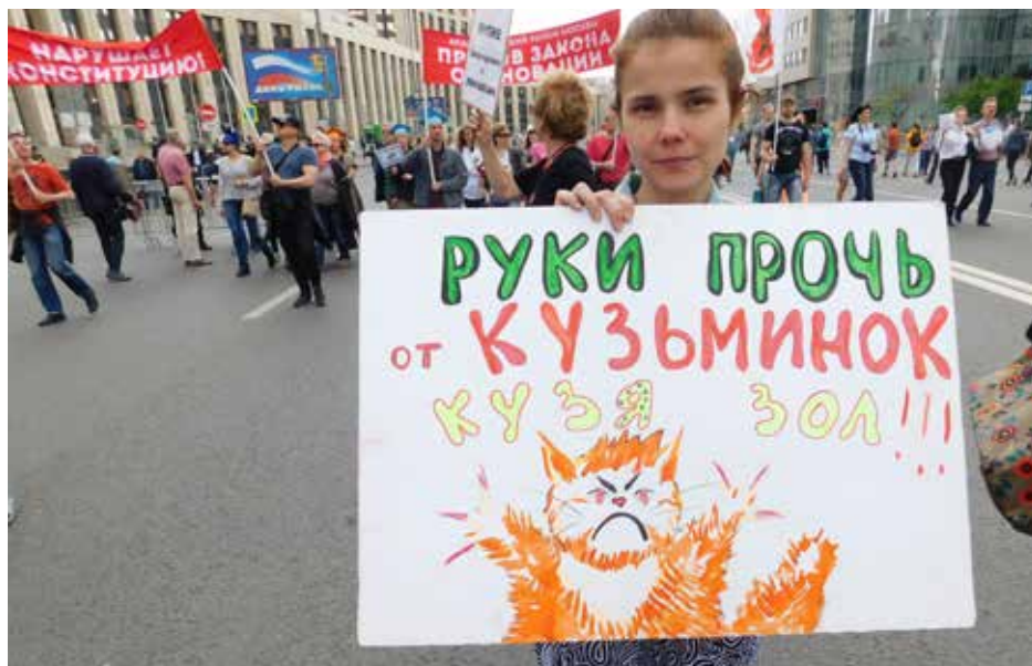
Илл. 4. Участница антиреновационного митинга 12 июня 2017 года на проспекте Сахарова.

Некоторые участники предпочитали использовать знак-икону 71 . На митинге 28 мая женщина около 60 лет держала в руках плакат, на котором был изображен рыбак с огромной щукой в руках (Илл. 5) — таким образом она представляла противников реновации из района Щукино. Другой участник митинга 28 мая прикрепил себе на голову листочек, на котором было написано «Головино против сноса». На митинге 14 мая девушка была одета в сарафан и веночек — она своим нарядом изображала «икону» — эмблему района Марьиной рощи (Илл. 6). Если автор плаката с нарисованной щукой сделала содержание своего высказывания довольно прозрачным, то в последних двух случаях реципиенту предлагалось разгадать ребус или шараду, чтобы понять, о чем идет речь.