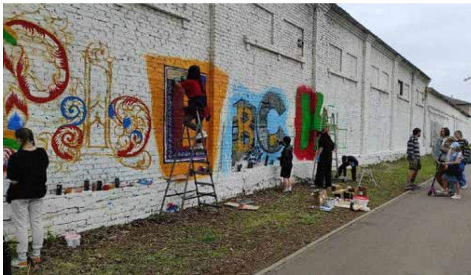
Рис. 6–7. Создание мурала и наблюдающие за процессом. Fig. 6–7. The creation of the mural and those observing the process.