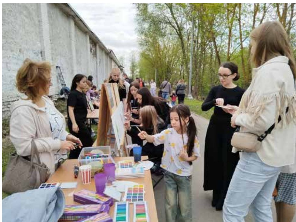
Рис. 8–9. Площадки фестиваля «Диковинная Гуслица». Fig. 8–9. The venues of the “Curious Guslitsa” festival.

Чтобы поддержать тему города как объекта художественного взгляда, рядом с муралом мы организовали поп-ап выставку: на натянутой сетке для футбольных ворот разместили пленэрные работы студентов художественного отделения Колледжа педагогики и искусств с видами Егорьевска — как знаковыми, так и вполне типовыми. Необычный