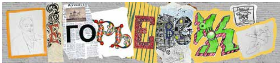
Рис. 4. Эскиз мурала, разработанный участниками арт-лаборатории.

За несколько недель группа подготовила проект мурала, который в итоге оказался посвящен Егорьевску. Признаться, для нас такое решение стало неожиданным и в логике всего проекта — безусловно радостным. Показательно, что в композиции проявились отсылки к разным историческим и культурным символам города, о которых шла речь выше. Сам выбор городской истории в качестве темы показывает, что этот пласт оказался для участников лаборатории значимым, знакомым и актуальным; обращение к нему выглядело естественным, а не было продиктованным извне. Композиционно мурал представлял собой коллажную надпись «Егорьевск», в которой каждая буква создавалась одним или несколькими участниками команды и отсылала к определенному историческому периоду или культурному мотиву.