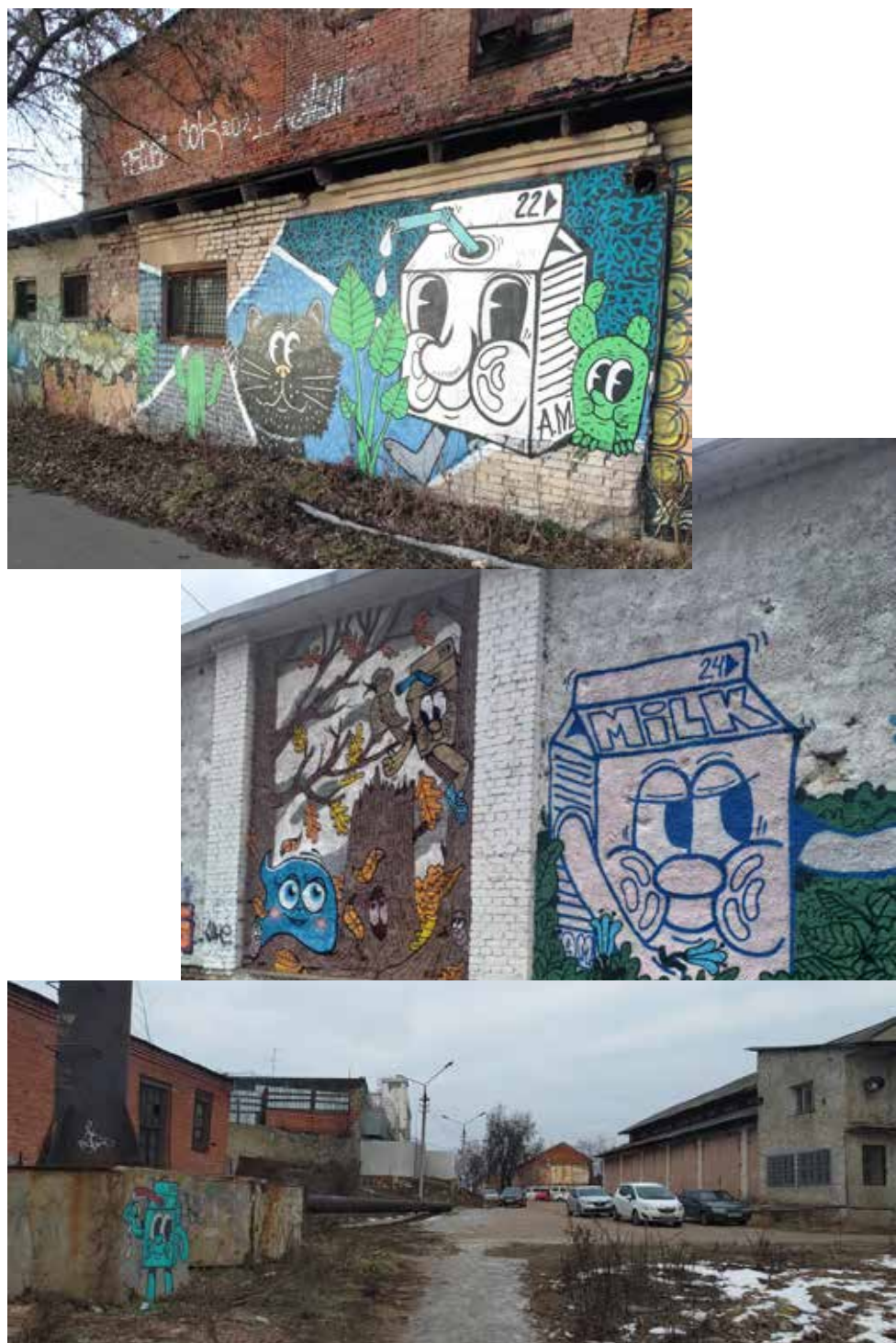
Рис. 1–3. Работы Данилы TimeofMilk на набережной Гуслицы и рядом с ней.