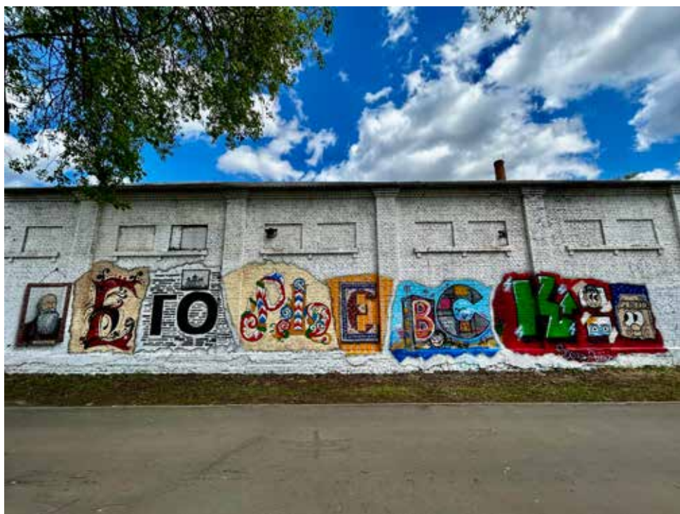
Рис. 5. Мурал «Егорьевск» на набережной Гуслицы. Fig. 5. “Yegoryevsk” mural on the Guslitsa embankment.

РАН 1958 года в Орехово-Зуевском и Куровском районах Московской области, в ходе которой были обнаружены старообрядческие певческие рукописи XVIII – начала XIX века. Это событие нередко описывают как «второе рождение» гуслицкой росписи. Буква «Е» напоминает «бабушкин ковер» и отсылает к детским воспоминаниям участников лаборатории. Буквы «В» и «С» представляют собой советские хрущевки, типичную застройку егорьевских микрорайонов. Наконец, буква «К» отражает современность: в нее встроены персонажи местных уличных художников, в том числе завершающий всю надпись пакет молока Данилы TimeofMilk.